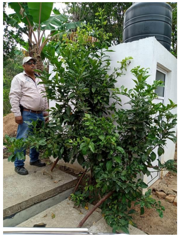
Figura 3. Exploración para detección de síntomas de Leprosis

c) Control cultural (Leprosis). En seguimiento a la detección de plantas con síntomas de leprosis de los cítricos en el mes de abril en el Municipio de Tepeojuma, en el mes de mayo se realizó la poda de 14 plantas y aspersión de insecticida abamectina para control del insecto vector.