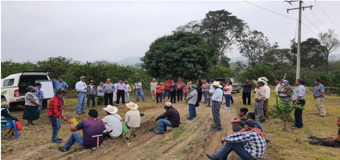
Figura 4. Talleres participativos a productores sobre síntomas de plagas reglamentadas de los cítricos

las acciones mediante el establecimiento de AMEFIs, se realizaron 6 Talleres Participativos; 2 en Francisco Z. Mena Municipio correspondiente a la Región Sierra Norte; 2 en Acateno, 1 en Hueytamalco y 1 en Ayotoxco de Guerrero, municipios correspondientes a la Región Sierra Nororiental. Con esta acción se benefició un total de 95 productores.