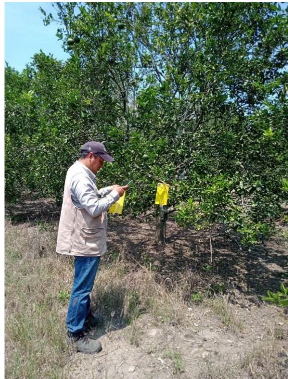
Figura 2. Trampas establecidas y revisadas para el monitoreo del PAC.

b) Exploración. Con el fin de detectar los problemas fitosanitarios descritos en el Manual Operativo de la Campaña contra Plagas Reglamentadas de los Cítricos, se realizó la revisión de las 40 plantas que componen los 90 sitios de monitoreo ("T" simple), es decir un total de 3,600 plantas, no detectándose síntomas de otros problemas fitosanitarios de interés cuarentenario.